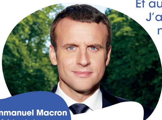
Emmanuel Macron président de la République

J'appelle à une grande mobilisation nationale pour les habitants des quartiers, une mobilisation qui concerne chacun d'entre nous. Je veux que le visage de nos quartiers ait changé d'ici la fin du quinquennat.”