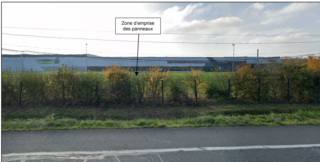
Photographie E, prise en décembre 2022