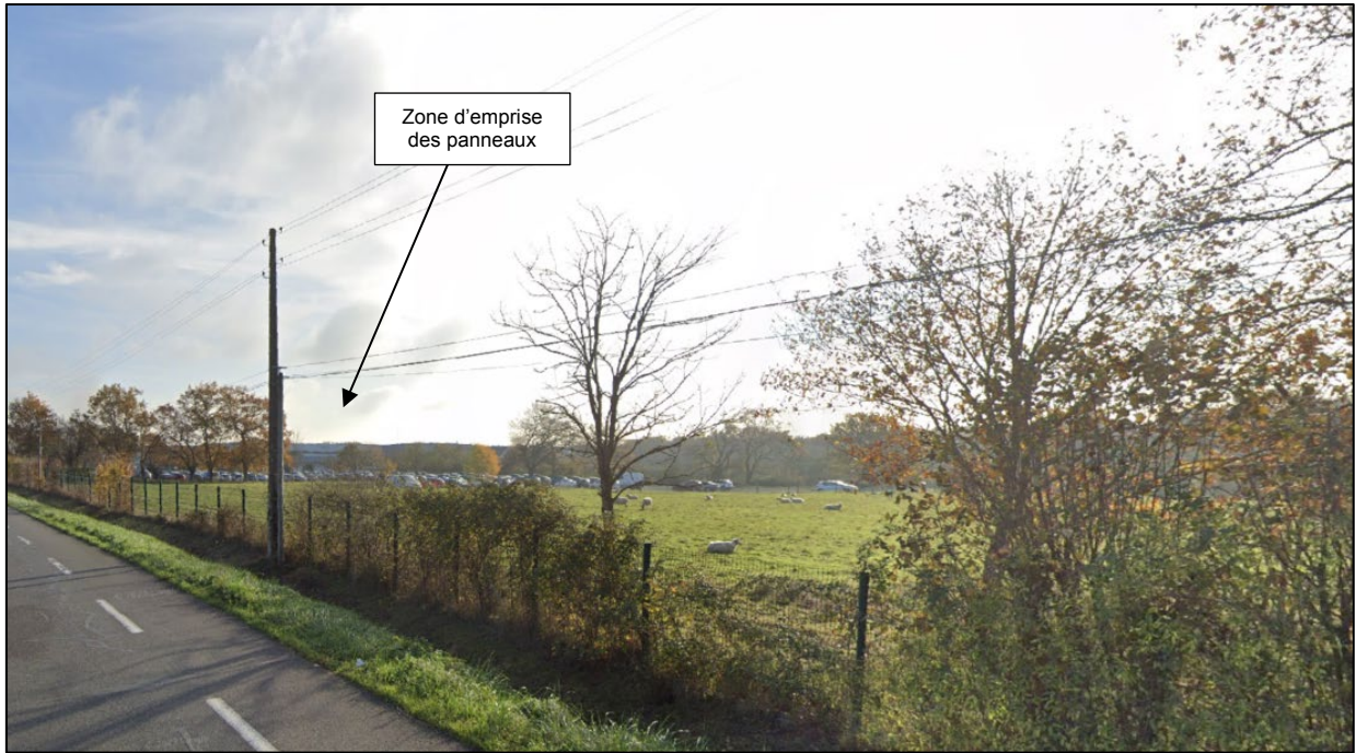
Photographie 1, prise en décembre 2022