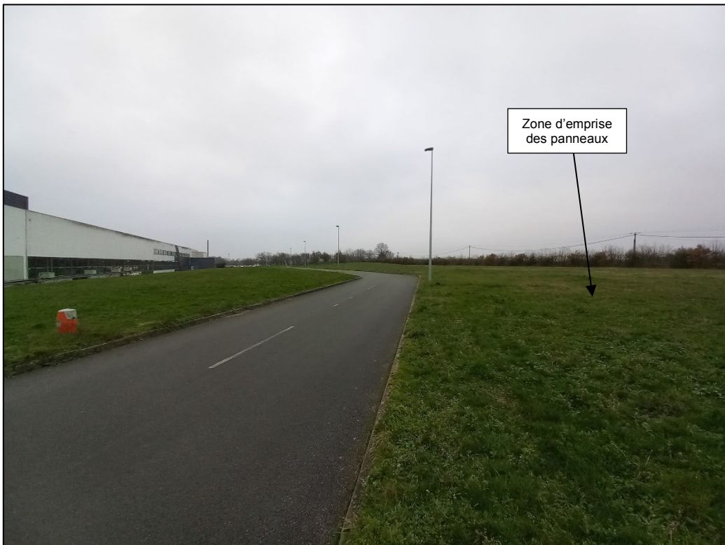
Photographie D, prise le 24/01/2023