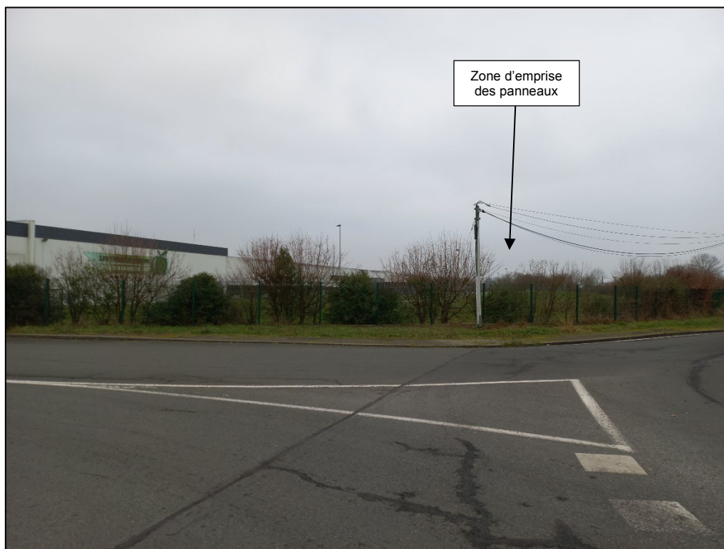
Photographie F, prise le 24/01/2023