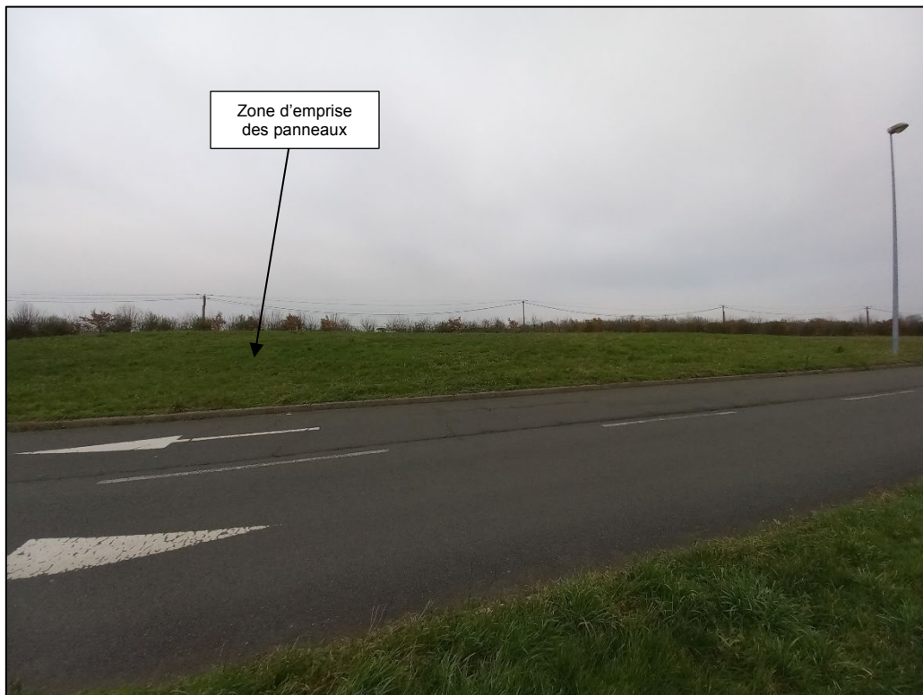
Photographie B, prise le 24/01/2023