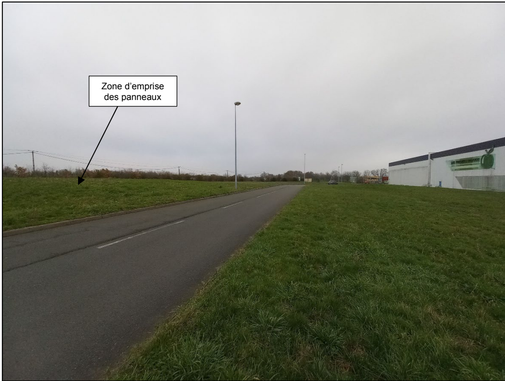
Photographie C, prise le 24/01/2023