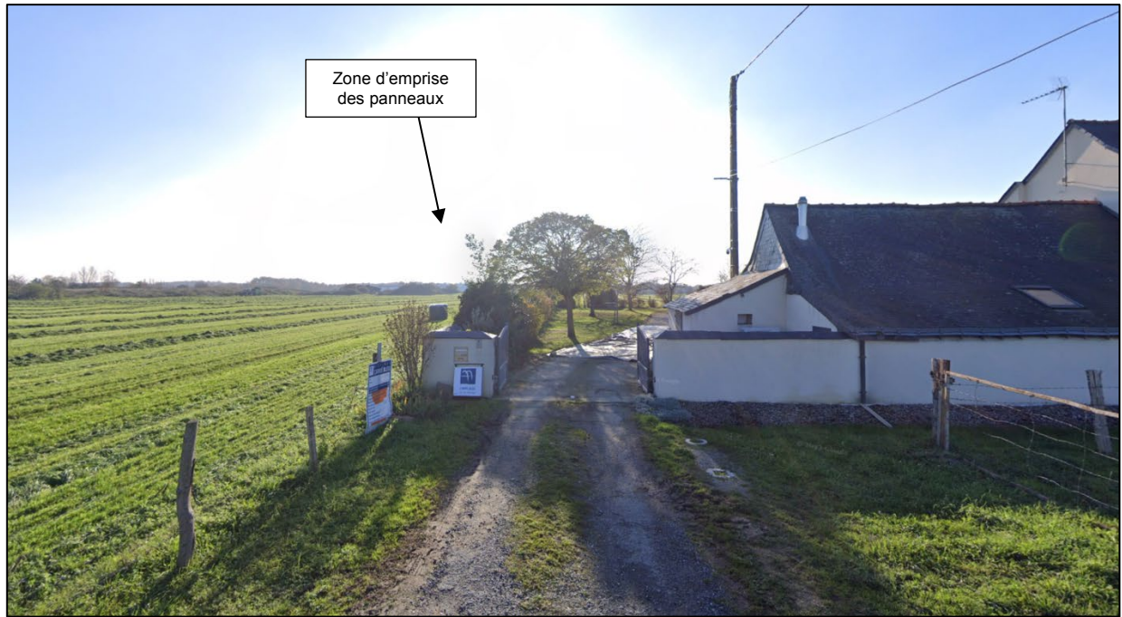
Photographie 3, prise en décembre 2022