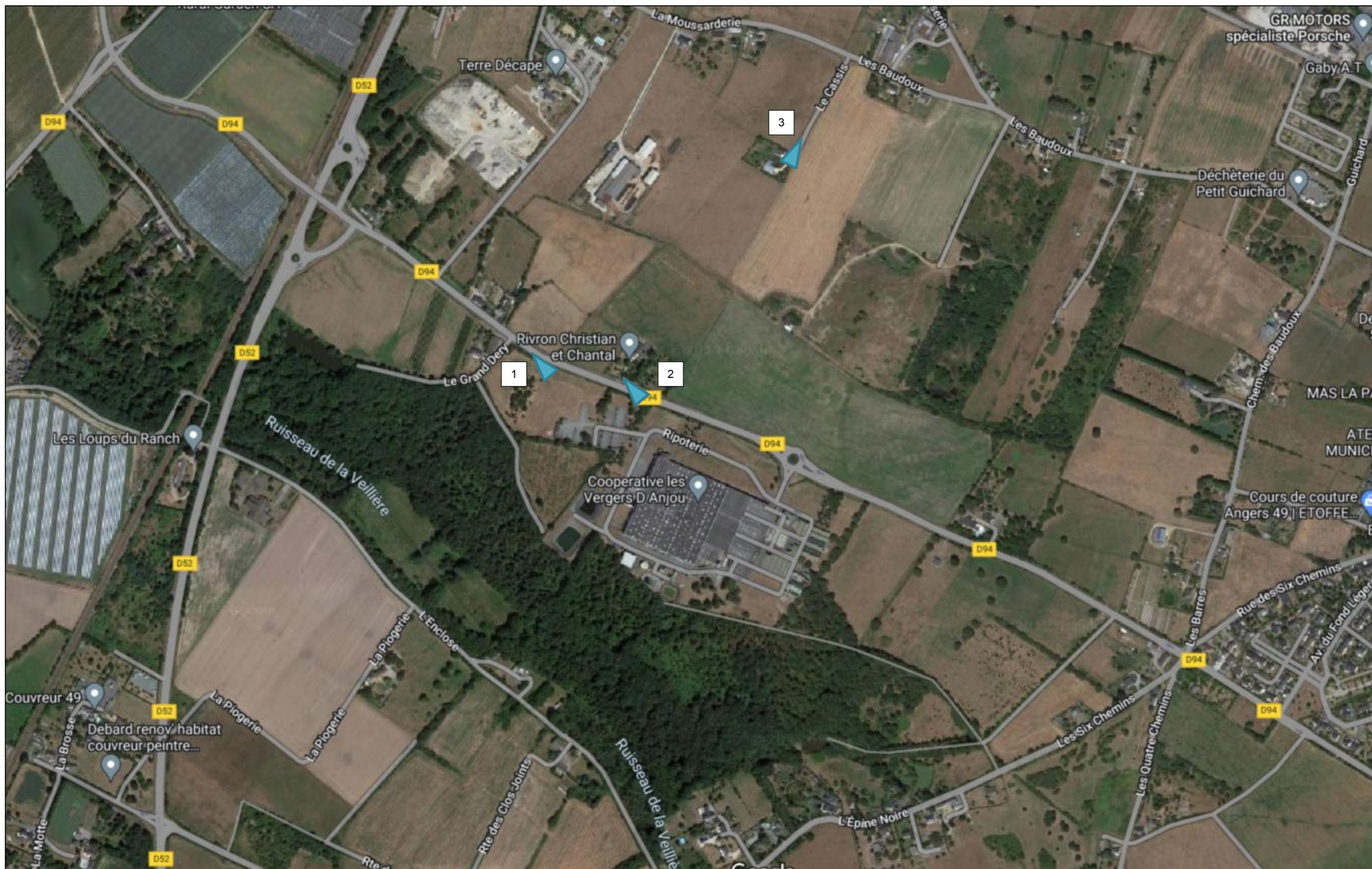
Figure 2 : Localisation des prises de vue éloignée de la zone d'emprise du projet – Centrale photovoltaïque au sol – VERGERS D'ANJOU – VERRIÈRES-EN-ANJOU (49)