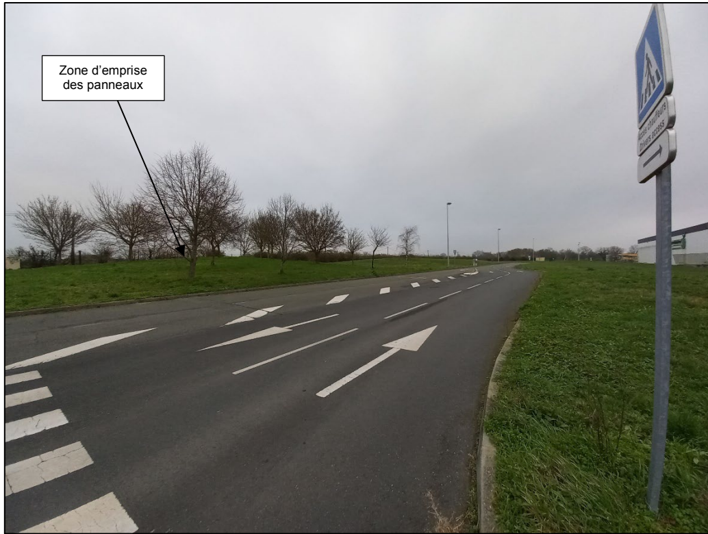
Photographie A, prise le 24/01/2023