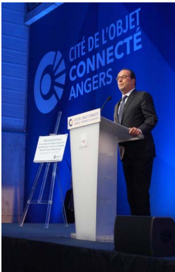
Inauguration de la Cité de l'Objet Connecté par le Président de la République, le 12 juin 2015

➤ 15 déclarations de création d'emploi d'une durée indéterminée ou supérieure à 12 mois ont été enregistrées dans les zones de revitalisation rurale (ZRR) , donnant lieu à une exonération totale de cotisations sociales pour les entreprises de moins de 50 salariés.