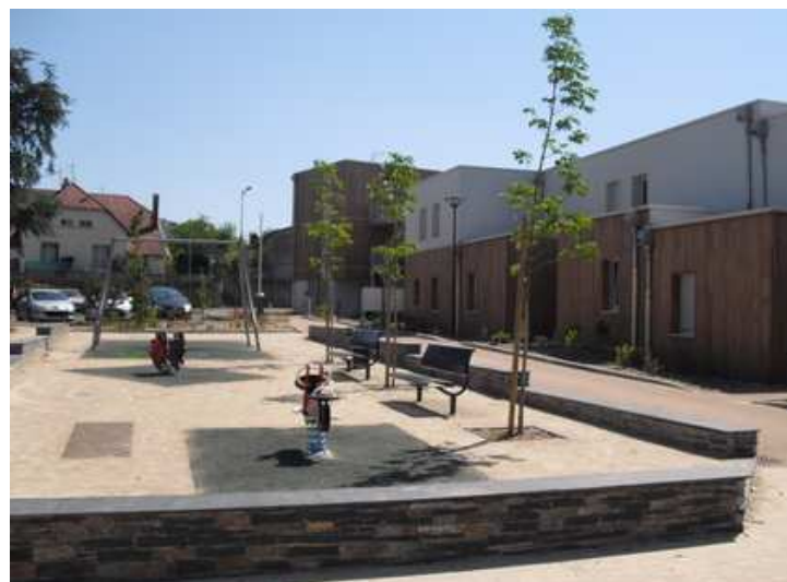
Les Jardins de Fricotelle – Saumur