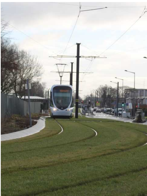
Plateau des Capucins - Angers