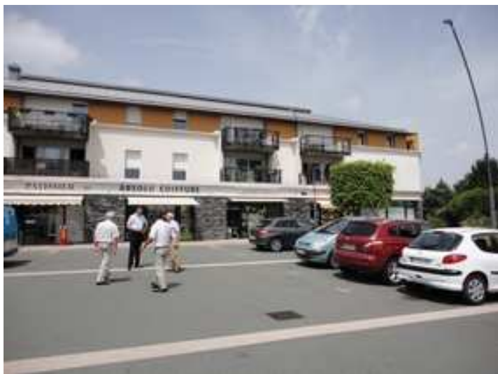
Centre-bourg – Beaucouzé