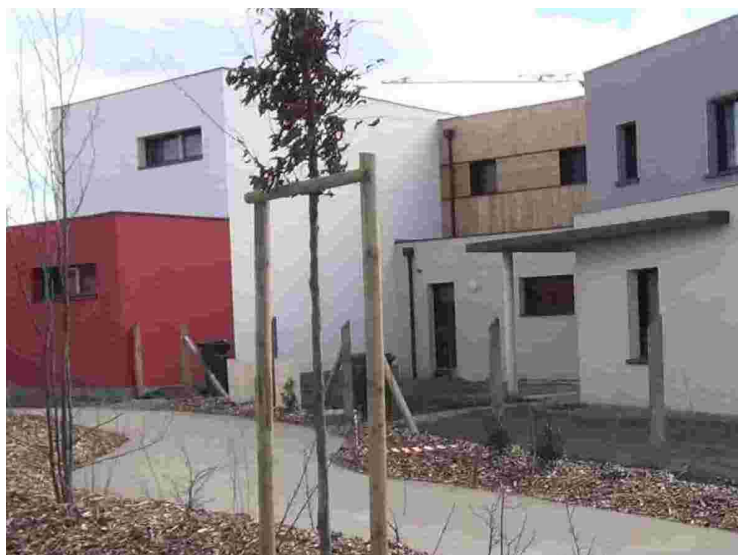
Legéry – Saint-Léger-des-Bois