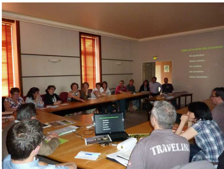
Saint Laurent de la Plaine/ Bourgneuf-en-Mauges