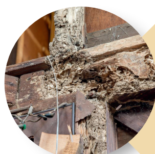
Attaque sur une charpente