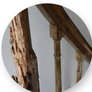
Attaque sur des escaliers