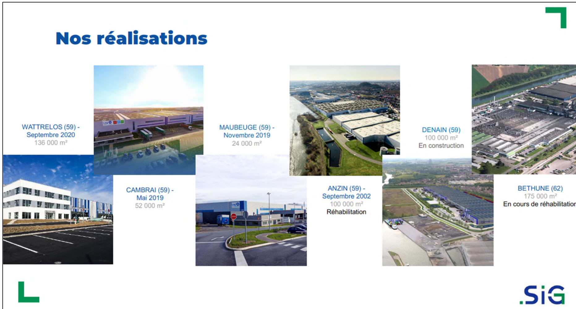
Figure 2. Réalisations de la société SIG