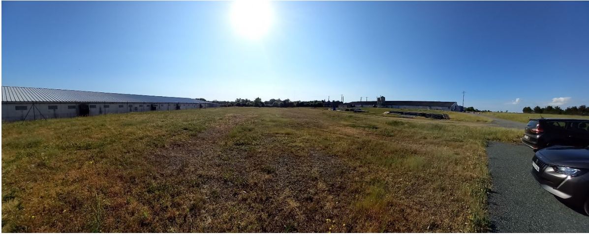
Photographie n°1, prise le 17/05/2022 à 09h56