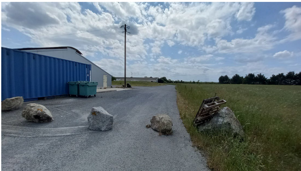
Photographie n°3, prise le 17/05/2022 à 13h48