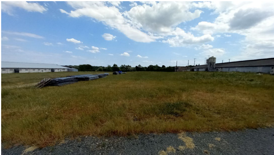
Photographie n°2, prise le 17/05/2022 à 13h48