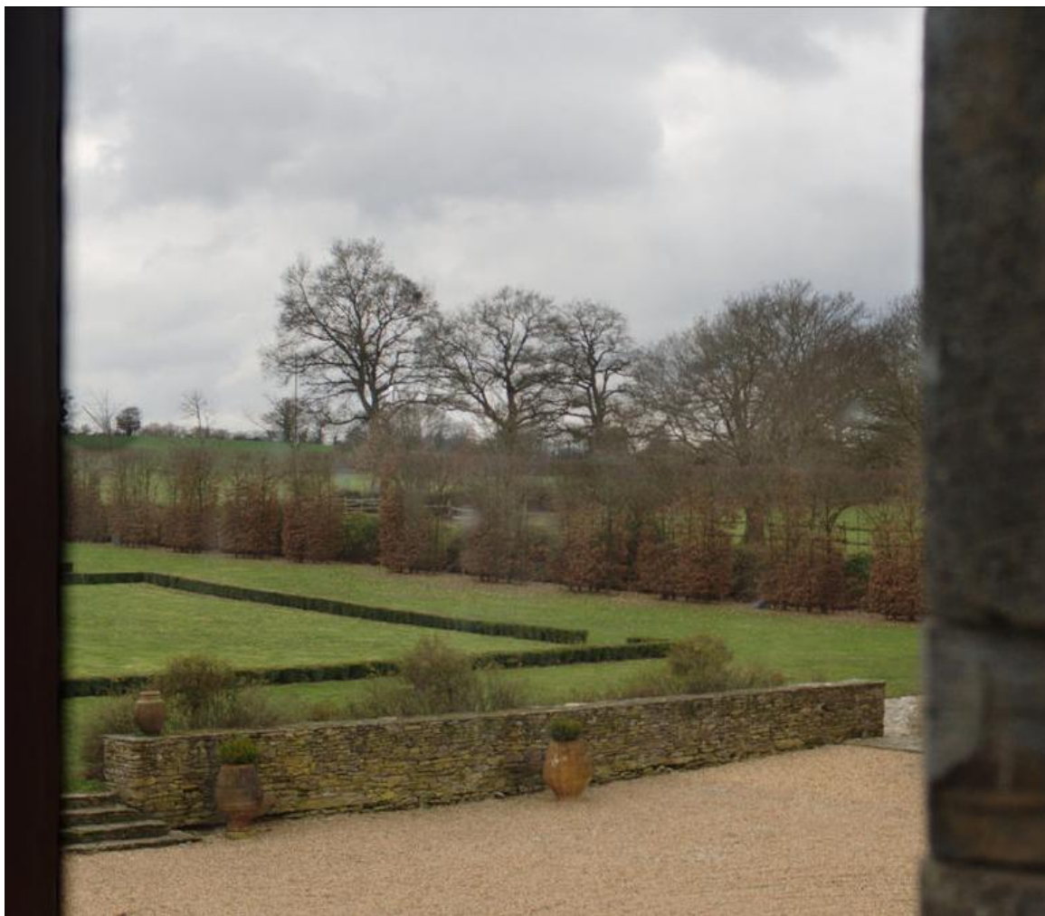
Figure 1 Photomontage depuis de deuxième étage du Château du Bois Geslin : aucune éolienne visible pour la variante à 5 éoliennes.

Pour cette variante 2, présentée en pôle en mai 2013, les photomontages réalisés démontraient que les éoliennes n'étaient pas visibles depuis les abords immédiats du château du Bois Geslin et depuis le premier étage (Cf. photomontage ci-après). Depuis ces lieux les éoliennes étaient totalement masquées par les arbres de la propriété.