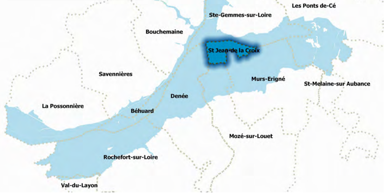
Carte du zonage réglementaire Dossier d'Approbation Echelle : 1:5000

Vu pour être annexé à l'Arrêté Préfectoral en date du : 23 février 2021..... Pour le préfet et par délégation Le directeur départemental des territoires